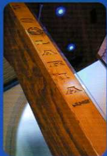
LOGO INCISO SUL LEGNO

Its style is new and exclusive, with ALL-WOODEN base, roof and external structure and with platform decorated in MOSAIC tiles; all of which can be customized with a wide selection of colours.