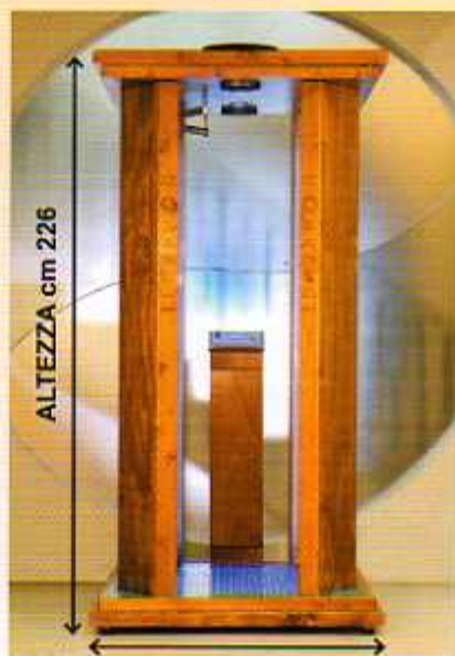
LARGHEZZA cm 109

Outlet nozzle: height 8 cm, diam. cm 20, or cm 30 depending on the fan chosen.