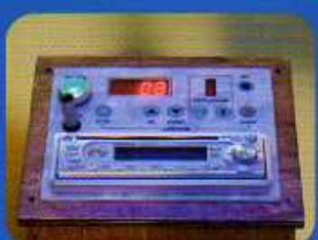
PANNELLO DI COMANDO