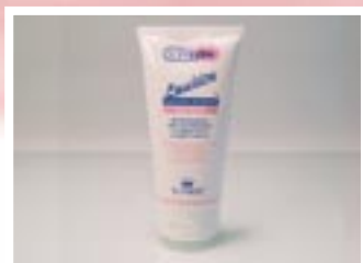
PROFESSIONALE E DOMICILIARE