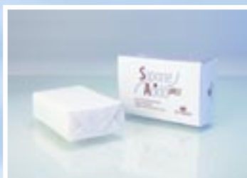
PROFESSIONALE E DOMICILIARE