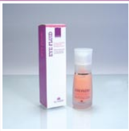
PROFESSIONALE E DOMICILIARE