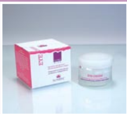
PROFESSIONALE E DOMICILIARE