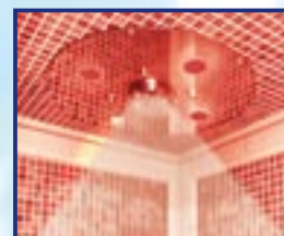
LED ROSSO PIOGGIA TROPICALE CON ESSENZA AROMATICA B