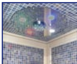
LED BIANCO LUCE DI CORTESIA