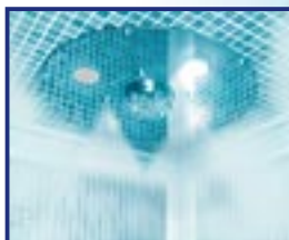
LED BLU NEBBIA CON ESSENZA AROMATICA A