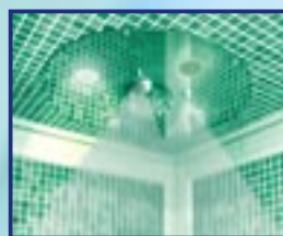
LED VERDE PIOGGIA CON ESSENZA AROMATICA B